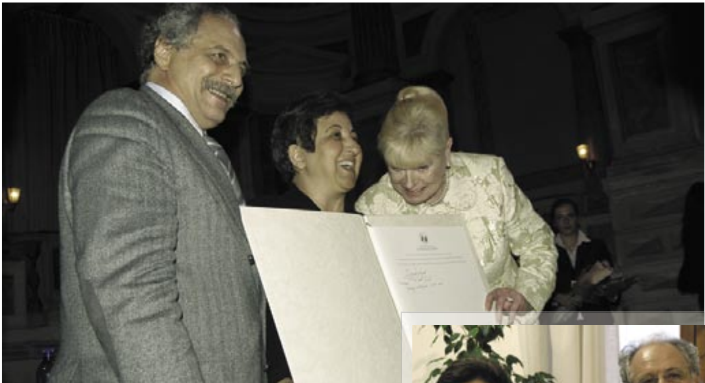
Mantua, Italy, October 7 th 2008. At the event presenting the Campaign to support the IAES project "International Environmental Criminal Court". Above: Antonino Abrami, Acting President of IAES with the Nobel Peace Laureates Betty Williams and Shirin Ebadi, primary signatories of the Honor Book of Endorsements.

In questo contesto la voce dell'Europa unita è di fondamentale importanza e pertanto, la IAES si augura che presto sia presentata in sede di Parlamento Europeo e in sede Plenaria, con la partecipazione del Consiglio e della Commissione Europea, una proposta di risoluzione , affinché il Parlamento Europeo e le altre Istituzioni si pronuncino in favore dei due progetti; risoluzione da trasmettere poi all'ONU e a tutti gli Stati firmatari dello Statuto di Roma, per la prossima Assemblée degli Stati membri.