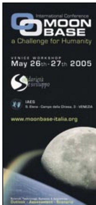
IAES international conference posters Manifesti di conferenze internazionali IAES