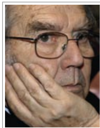
Adolfo Perez Esquivel Nobel Peace Laureate / Premio Nobel per la Pace

(updated October 15 th 2008 / aggiornamento al 15 ottobre 2008)