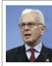
Hans Pottering , President of the European Parliament

Rigoberta Menchú Tum was born in 1959 in the Maya village of Chimal, Guatemala. Her mother, father and brother were killed during a time of political upheaval in Guatemala. She was exiled from Guatemala and went to Mexico. In 1992, Rigoberta Menchú was awarded the Nobel Peace Prize, in recognition of her work for social Justice an ethnocultural reconciliation based on respect for the rights of indigenous people. She became, the first Indigenous and the youngest person ever to receive this distinction.