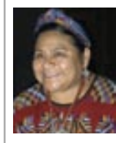
Rigoberta Menchú Tum , Nobel Peace Laureate