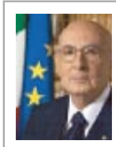
Giorgio Napolitano , President of the Italian Republic