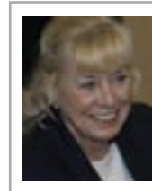
Betty Williams , Nobel Peace Prize Laureate

"(...) Senegal endorses this appeal, which I have signed and enclose herewith. Regarding the meeting due to be held in Venice in 2009, I await confirmation of the date so that I may try to fit it into my appointment schedule (...)"