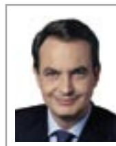
José Luis Rodríguez Zapatero , President of the Spanish Government

In 1976 Betty Williams won the Nobel Peace Prize with Mairead Corrigan Maguire, for their work in bringing peace to Northern Ireland. In 1992 Betty Williams founded the Global Children's Studies Center, which subsequently became World Centers of Compassion for Children International in 1997. Betty Williams has spent many years in the planning and realization of the first Centre of Compassion for children, in Italy.