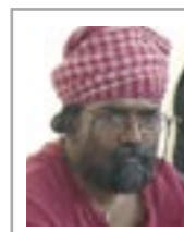
Satinath Sarangi , Engineer, activist and founder of the Sambhavna Trust, free clinic for the Bhopal survivors

I wish you every success with your project of broadening the tasks of the International Criminal Court (...)"