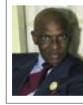
Abdoulaye Wade , President of the Republic of Senegal